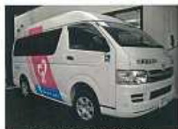
リフト付き 送迎車両