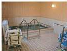
機械浴室(ライナー浴)