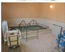
機械浴室(ライナー浴)